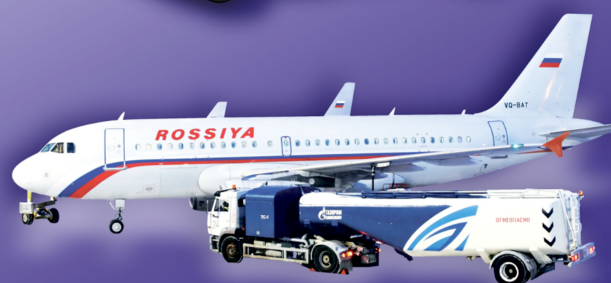
ЭЛЕКТРОННЫЙ ПАСПОРТ ТОПЛИВ