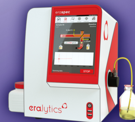
ERASPEC ЭКСПРЕСС - АНАЛИЗАТОР БЕНЗИНА, ДТ, АВИАКЕРОСИНА

собственное производство лабораторного оборудования европейского качества!